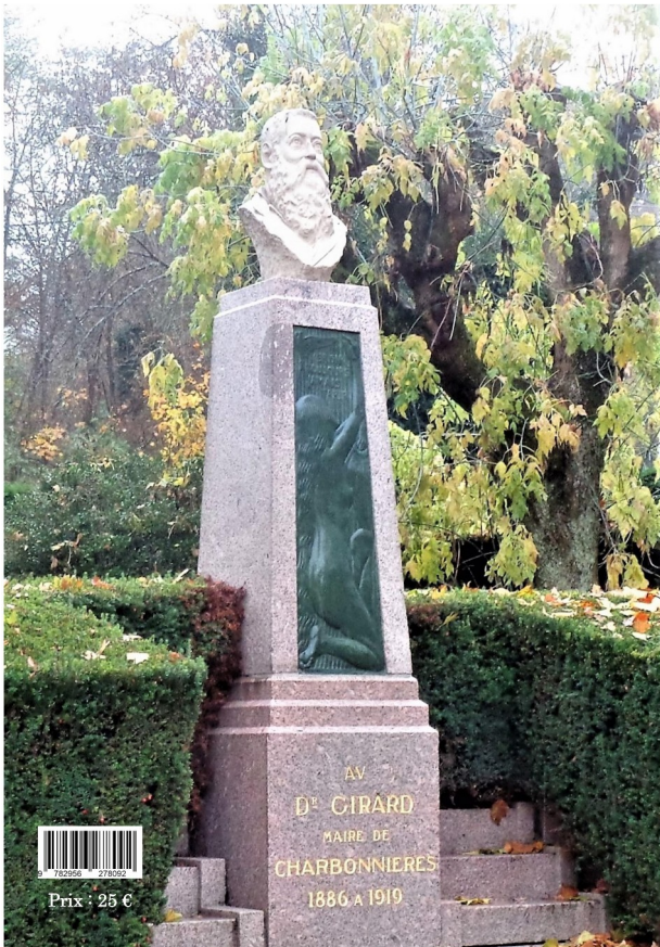
Delibérations du Conseil municipal de Charbonnières-les-Bains 1884 - 1914